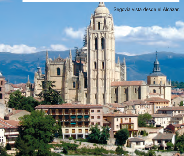
Segovia vista desde el Alcázar.