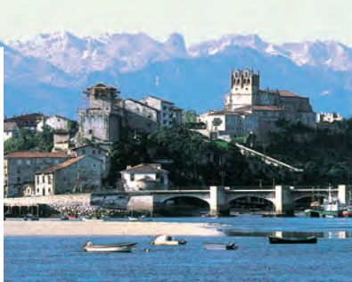
Real Sitio de Covadonga.