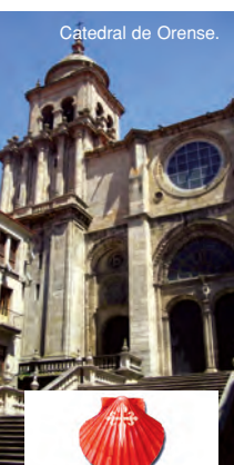
Catedral de Orense.