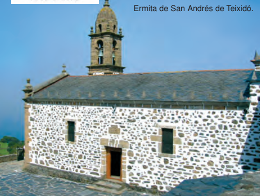
Ermida de San Andrés de Teixido.