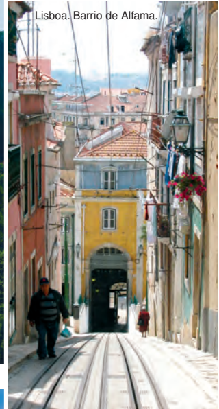
Lisboa, Barrio de Alfama.