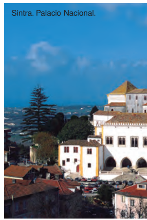
Sintra, Palacio Nacional.