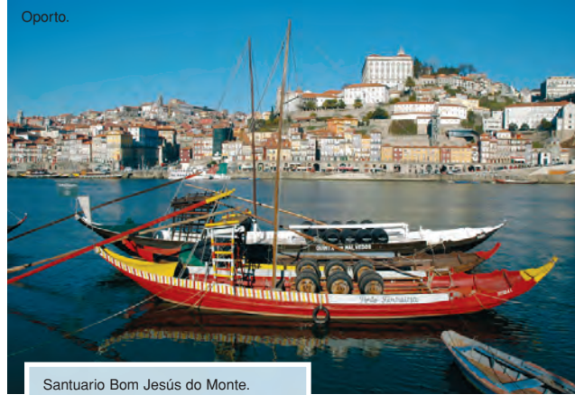
Santuario Bom Jesus do Monte.