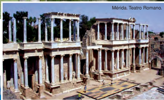
Mérida. Teatro Romano.