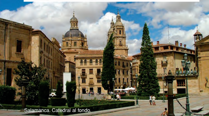
Salamanca. Catedral al fondo.