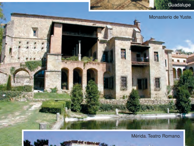
Monasterio de Yuste.