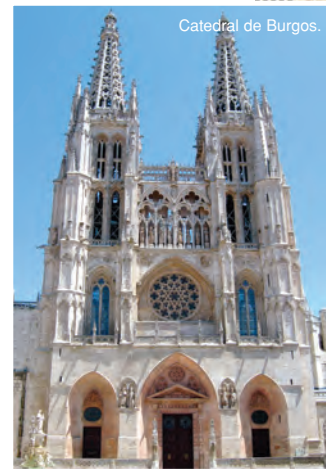
Catedral de Burgos.