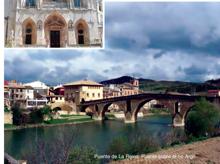
Puente de La Reina. Puente sobre el río Argo.